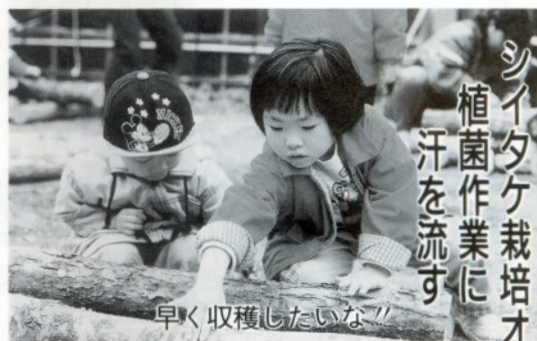
早く収穫したいな

四月十九日、シイタケ栽培オーナー会員による植菌作業がふるさと林間ファミリー園で約八十人が参加し行われました。