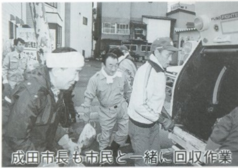
成田市長も市民と一緒に回収作業

四月十日の回収作業では各町内会から七十人が参加し、「市民と行政が信頼関係のもと一緒に汗を流すのは大変意義深い」と成田市長があいさつ後、国道三三九号を起点にし栄町から敷島町踏切までの区間を二班に分かれ前もって道路脇に積んでいた泥袋を一つ一つ、シヨベルカー、ダンプカーに積みこむ作業をし、街の環境の美化に努めました。