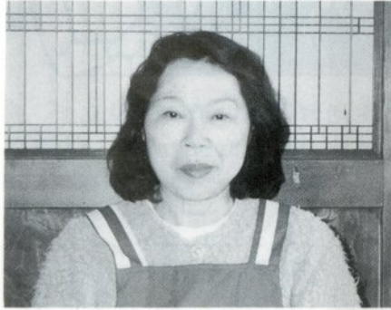
|| 下岩崎 ||