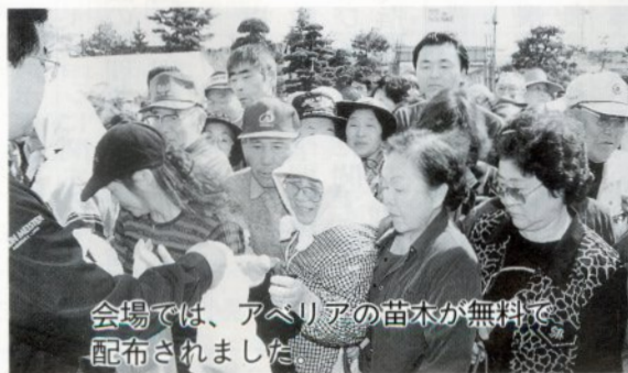
会場では、アベリアの苗木が無料で配布されました。

四月二十三日から三日間、花と緑の市と称して第二十六回市環境緑化まつりが市役所おまつり広場で行われ庭園樹、花木などを求める市民でにぎわいました。