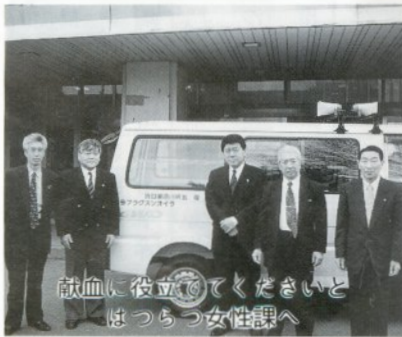
献血に役立ててくださいと はつらつ女性課へ