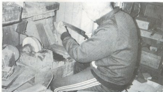
刃物研ぎ(銚子包丁)引受け

◎会員の資格の更新 現在センターに登録している会員の方は、3月31日で資格が切れます。引き続き更新を希望される方は、年会費3,000円をご持参のうえ、事務局まで。