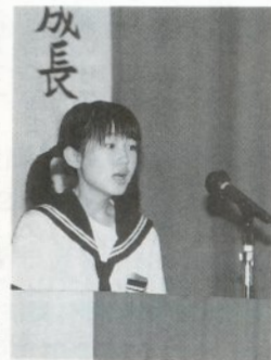
熱弁をふるう発表者

九月十日、市立三好中学校で青少年の健全育成を目的とした少年防犯弁論大会が開かれ、鶴田町及び市内各中学校より十二名の発表者が「いじめ」「自分の成長」などをテーマに中学生としての意見・主張を発表しました。