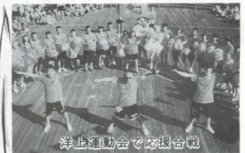
洋上運動会で応援合戦

中国で中国語を話してみたかった。中国語講座に通っている私は、生の中国語に接する良い機会と今回参加しました。 日中友好青年交歓会の場では、現地の青年達と話す機会を得ましたが、私の中国語はあまりうまく通じませんでした。でも、みんなやさしく、つたない中国語を話す