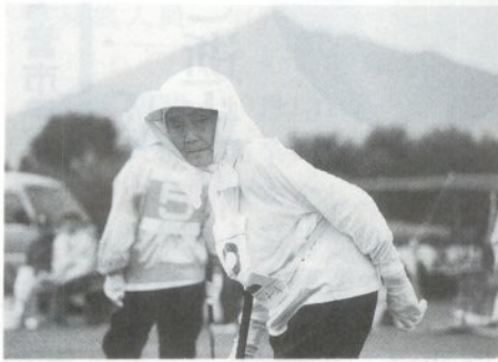
見つめるのはボールの行方、うまくいったかな？

9月13日、秋晴れとなった市営ゲートボール場（岩木川河川敷グラウンド内）で伊藤杯争奪ゲートボール大会が行われ、西北五各地域より53チーム、480名が参加し白熱した対戦を繰り広げました。