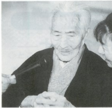
十八番「ドンパン節」を披露

「食べ物の好き嫌いはありません。歌を歌ったり踊るのが大好きです。特に若い頃、北海道でニシンを捕ったことなどの思い出話をよく語ります。」