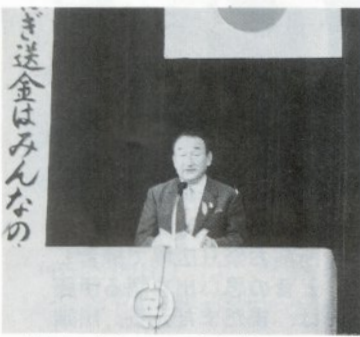
「健康に気をつけて、留守家族の方々も安心できる出稼ぎにしましょう」

その後、成田市市長は「当市の出稼労働者は年々減少しているが、仕事上のトラブル・事故も依然として存在しており、当協会はこれらについて支援していきたい。また、各地区協会の相談員がいますので是非活用してください」と出稼者、留守家族を励ましていました。