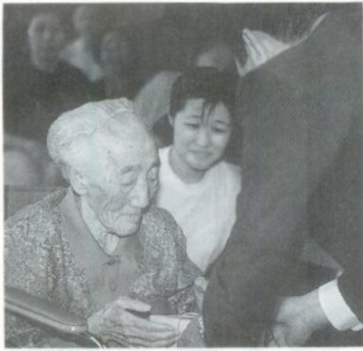
市長から記念品を渡されました

「何でも食べて早寝早起きが長生きの秘訣です。歌を聞いたり仲間のみんながお話しをしているのを見るのが好きです。」