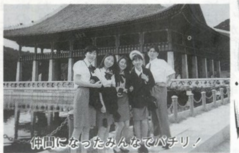
仲間になったみんなでパチリ!