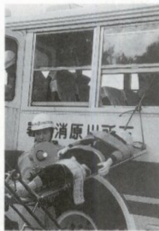
「今助けるぞ」「だいじょうぶですか」と救助者にかかる声も真剣そのもの

九月十二日、岩木川河川敷に置いて乗客十四名のバス事故を想定した対応訓練が五所川原、鶴田両消防署により行われました。