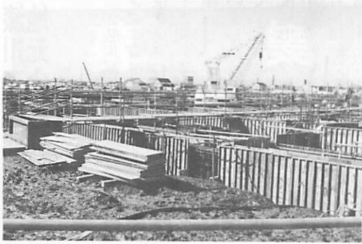
建設中のエルムの街

が、この度「環十和田プラネット広域交流圏推進協議会」に参画したことから、当市もその一員として、環十和田・津軽観光基地を広く内外に宣言し、観光振興を図っていきます。