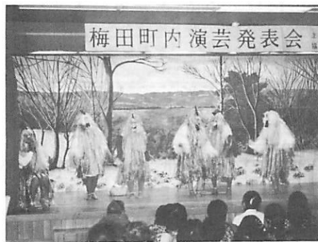
みんな大笑い 鶏一家の踊り

三月二日、歌・踊り・人形劇などメニューたっぷりの梅田町内演芸発表会が梅沢コミュニティセンターで行われました。 十二年連続となった発表会では村内外から観客約二百名が詰めかけステージいっぱいになり、繰り広げる芸達者の演技に拍手をしたり歓声をあげたりして大人も子供も大喜びでした。 今大会は今までに一番多い九団体の岩木山の絵（慈眼寺・三浦住職制作）は大変迫力がありました。