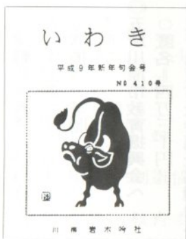
四一〇号目の会報「いわき」