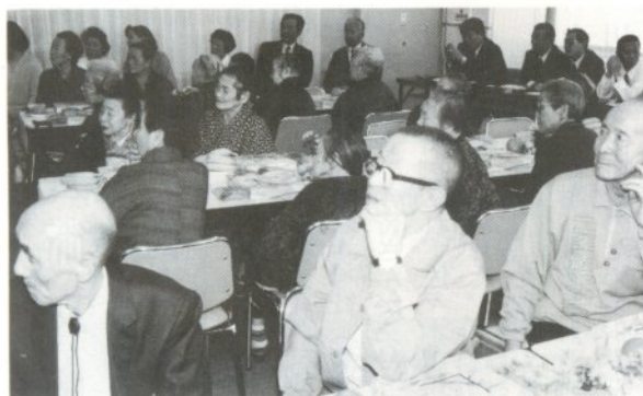
踊りに見とれるお年寄り

この日は、入園者の誕生会も行われ、会員らはそばなどを振る舞いながら一緒に祝いしカラオケなどで楽しんだ後、全員で「また会う日まで」を合唱しライオンズクラブの皆さんは、来年も慰問することを約束しました。