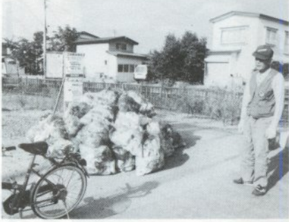
集積所に積まれた指定ごみ袋の山

十月一日から指定ごみ袋を使用するなど、ごみの出し方が変わり、初日はトラブルもなく順調なスタートを切りました。多くの市民は、新しいルールを守りごみを出していましたが、一部の収集地区では、黒色の袋、無記名の袋等が見られ、収集しないケースもありました。普段焼却されるごみの平均は六十トンの日焼却されたごみは三十八トんで、ずいぶん減少しました。生活環境課では、今後とも、雑誌、新聞などはなるべく出さないでリサイクルにまわし減量化に協力してほしいと市民に呼びかけて行くつもりです。