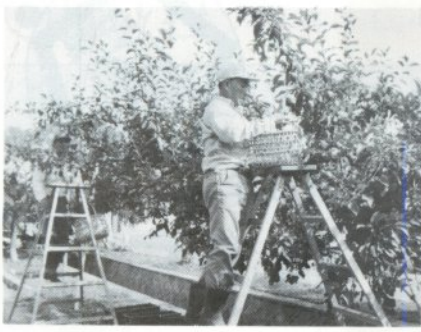
赤くいりんごを収穫する作業員

十月三日から五日まで、一ツ谷地区の赤くいりんごの並木道（長さ一・二km）で「赤くいりんご」の収穫が行われました。このりんごは、篤農家・故前田顯三さんが育成した実の中まで赤い世界でも珍しいりんごで、一ツ谷地区に約二百五十本植栽され今年六月に、「御所川原」と命名されました。今年のもごは、小玉傾向ですが、糖度が十四度前後で例年より甘みがあり、収量は昨年と同じ百七十箱収穫されました。このりんごは、ワイン、ジャム用として加工されます。