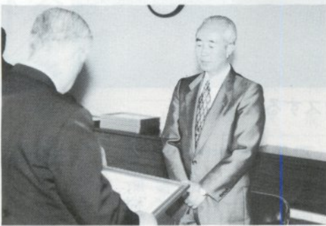
表彰された東北電力(株)五所川原営業所所長