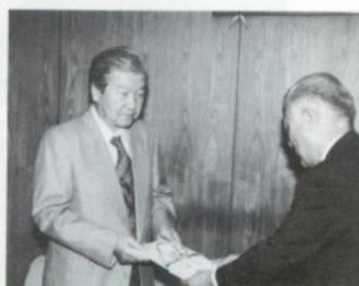
目録を渡す高松親和会副会長