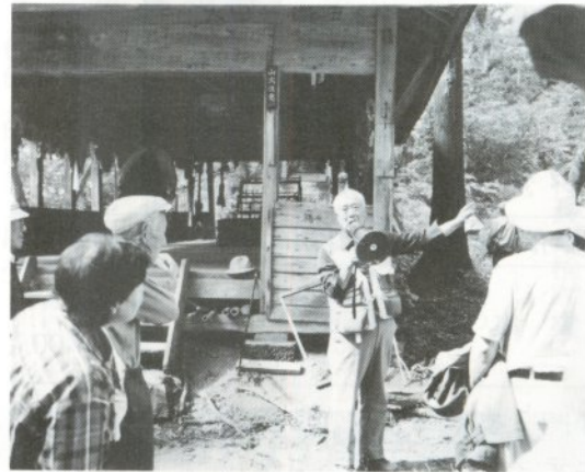
九月三十日に行われた 第一回 梵珠山古へのたび