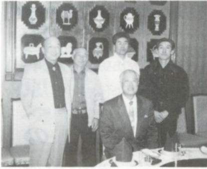
(株)矢野技研の皆さん