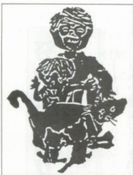
版画 梅泉小一年 たけやようこ