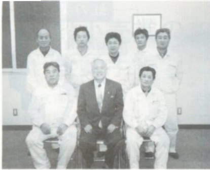
鳥羽工産(株)の皆さん