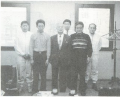
敷島製パン(株)の皆さん