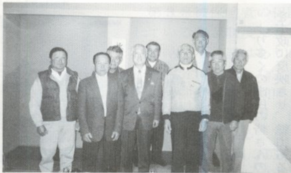
白石建設(株)の皆さん