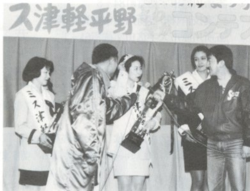
昨年のコンテスト風景