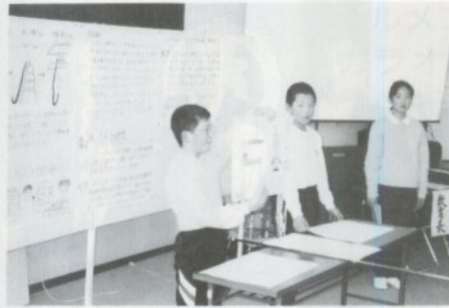
チーム・ワークも良かった藻川小5年の仲よし3人組