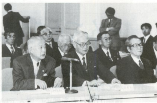
記者会見の席で質問に答える前左から佐々木五所川原市長、金沢弘前市長、清藤黒石市長。

今後は、国の公共事業重点投資などを念頭に置いた計画の具体化に向けた作業に入ります。