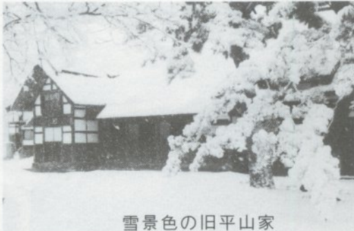
雪景色の旧平山家

市議会といたしましても、鋭 意研鑽に励みながらより豊かな 住みよいまちづくりを目指して 努力してまいりますので、どう か本年も相変わらぬご支援、ご 協力を賜りますようお願いし い申し上げまして新年のごあい さつといたします。