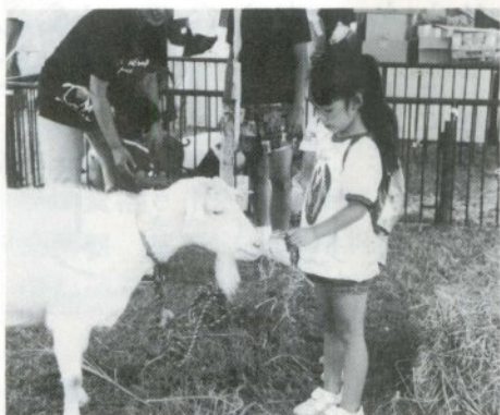
おっかなびっくり。 動物ふれあい広場