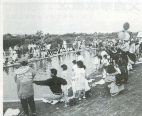
何びき釣れるかな？ 魚釣り大会