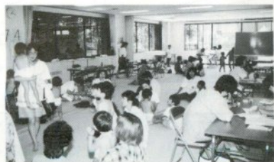
乳幼児の健診風景(市保健センター)

既に「受給資格証」が交付されている方は、資格証の有効期限まで引き続き使用できます。有効期限満了後、「受給資格証」の更新手続きをしてください。