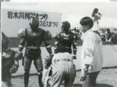
カッコイイな。 ビーファイター