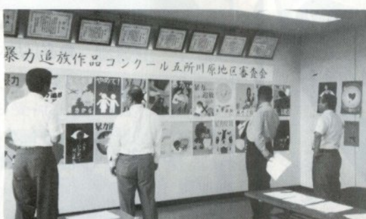
ポスター部門審査会場

コンクールには、標語部門に高校から十三点、ポスター部門に中学校から三十六点、高校から一点が寄せられ、審査員には