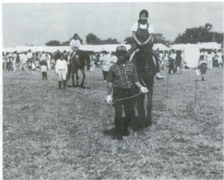
乗馬体験コーナー