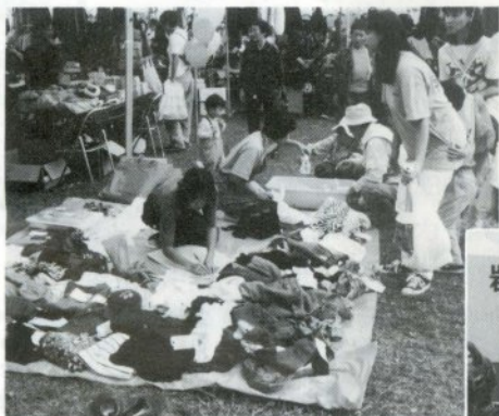
安いよ！安いよ！ フリーマーケット