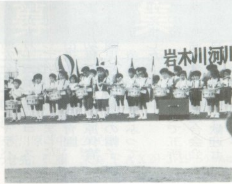
五所川原幼稚園の 鼓笛隊演奏

九月十五日、岩木川河川敷に おいて岩木川河川まつり&コス モスまつりが行われ、盛り沢山 のイベントに多くの市民、子供 たちで賑わいました。