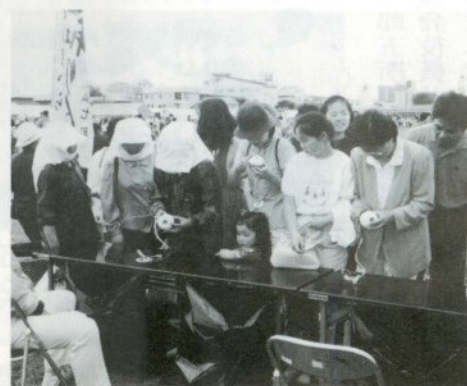
出来るだけ長く。 リンゴ皮むき競争