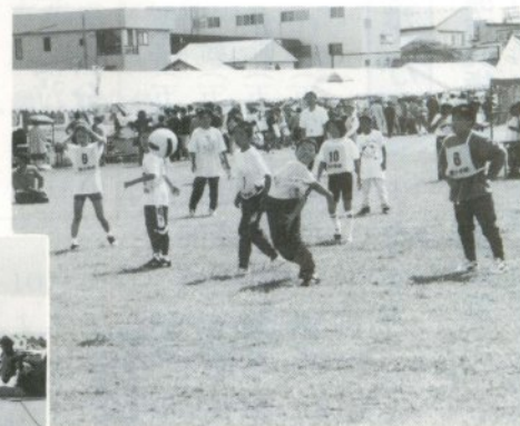
ドッジボール大会