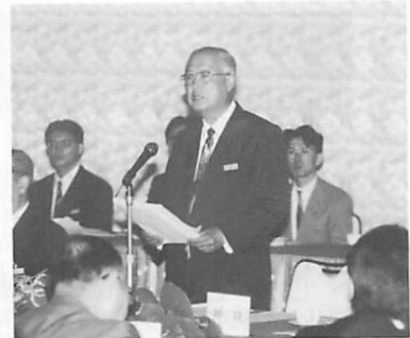
○西北五地域保健医療圏における地域医療の改善について(継続)

西北五の地域医療を抜本的に改善するために、「青森県保健医療計画の具体的な促進」とともに、当地域医療圏の中核的病院である西北中央病院の「高度医療設備の整備等に対する継続的な財政支援」「県立中央病院をセンターとする医師の適正配置のためのシステムづくり」を要望いたします。