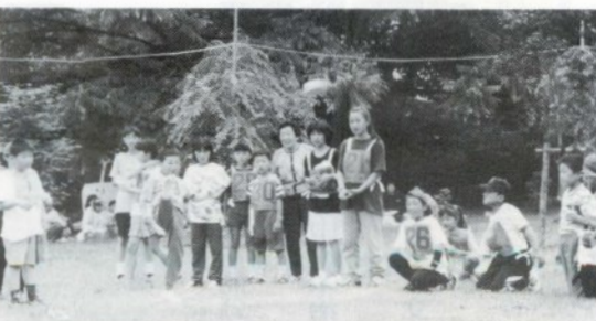
クツとばし大会決勝