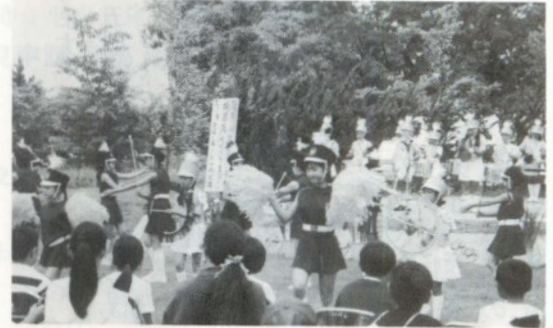
華やかにくりひろげる南小の鼓笛隊コンサート