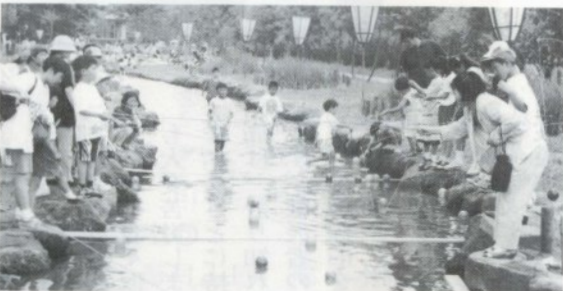
小さな子供にも釣れるヨーヨーのつかみどり