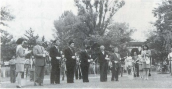
せせらぎまつりはテープカットで幕をあけた