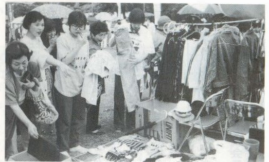
超安値で販売し、うりきれ閉店続出のフリーマーケット