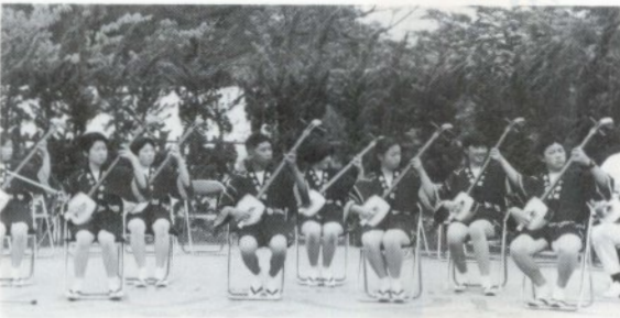
みごとなパチさばきを披露した東小児童の三味線演奏