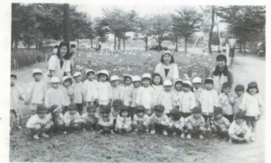
仲よく手をつなぎ、おまつりを見物する七和保育園の園児