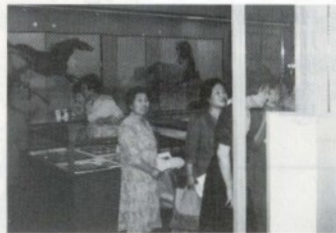
特別展も行った 歴史民俗資料館