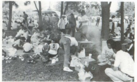
お昼は木陰で焼トリと生ビール