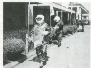
市庁舎周辺のゴミ拾い奉仕活動