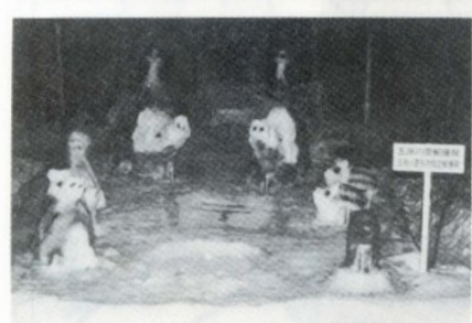
1位＝猪突猛進（五所川原郵便局 市内特定郵便局）