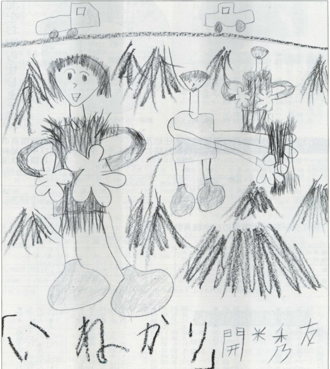
一年生の、家族大すきシリーズ⑫ (家族のことば 12ページ)

9月30日現在 ( ) 内は前回比、男23,706(+6) 女26,269(+7) 計49,975(+13) 世帯16,938(+2)