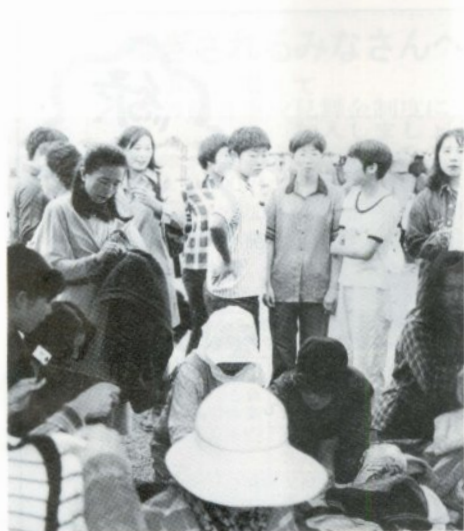
大盛況のフリーマーケット

店舗の参加料七万六千円（一店舗二千元）と寄付金九万六千七百十円（株青森銀行五所川原支店・株みちのく銀