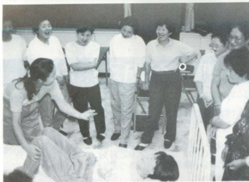
介護の技術を楽しく習得

西北中央病院第一内科の医師や特別養護老人ホーム青山荘の主任寮母等を講師陣に迎えてのこの講習会は、女性の