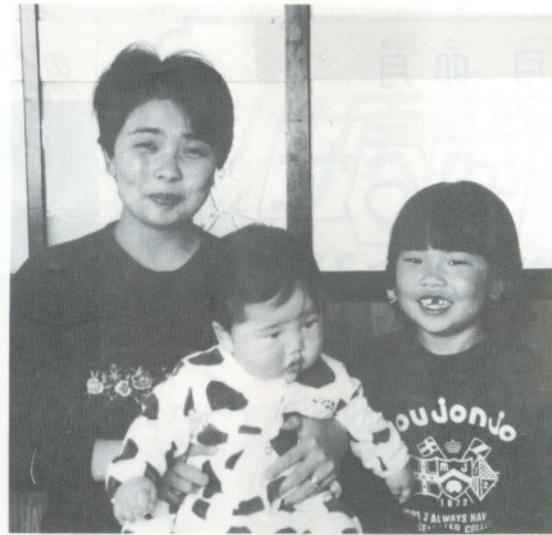
お母さん・弟・愛佳ちゃん (正華ちゃん)