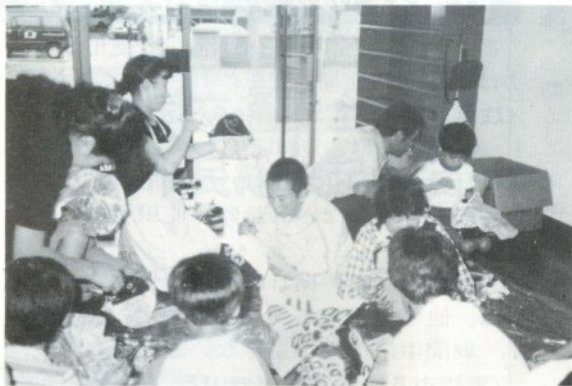
可愛い金魚ねぶたができました