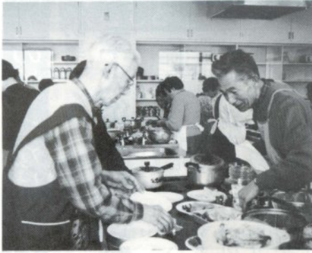
「次は、サラダでしたね」