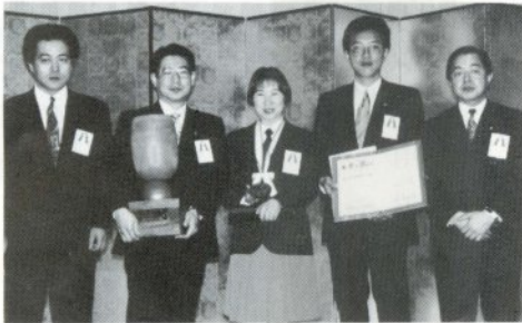
青年会議所のみなさん(中央は高校生代表)

ーム賞は下北の横浜町、ロマン賞は十和田湖町) 街の活性化は、人づくりから、と、市内六校の高校生を対象に、ハルニレ(市の木。タモの木ともいう)運動を展開してきました。