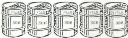
▶基本料金(1ヵ月につき)