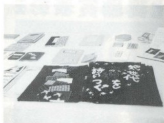
みごとな手づくり絵本