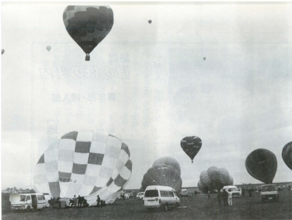
一基二基と空へ舞いあがる熱気球