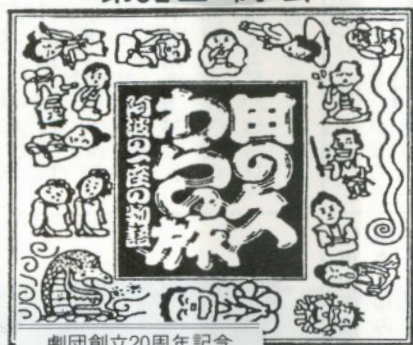
劇団創立20周年記念