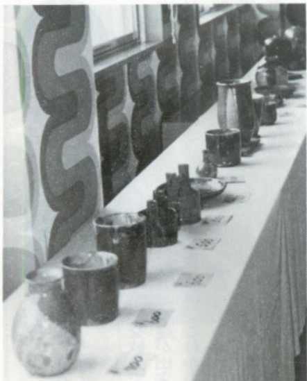
丹精こめた陶芸作品