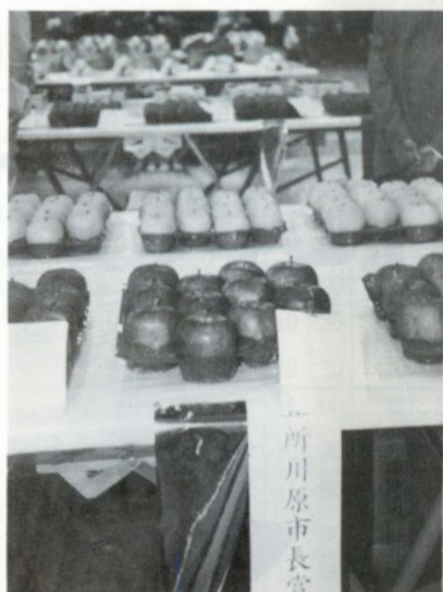
立派なりんごが並びました