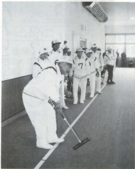
使用記念の第一球!

市地域福祉センター内の、屋内ゲートボール場(三七四平方メートル・約百十三坪)で、十一月一日、会員約百名が参加して使用記念の、第一回冬期練成市民ゲートボール大会が行われました。