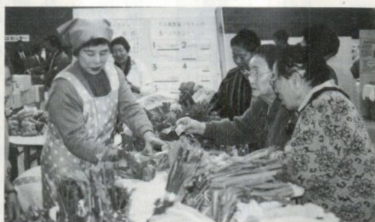
とぶよつな売れゆき