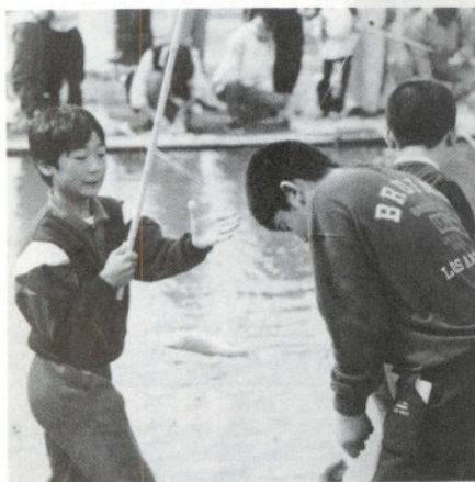
「釣れる、釣れる」ヤマメとニジマス