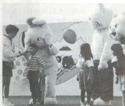
出る出る「しりとりにあそび」

「知ろう、ふれよう、母なる川の豊かな恵み」をテーマに十月十日、 体育の日に開催された、「岩木川河川まつりとコスモスまつり」は、 良いお天気に恵まれ、大ぜいの市民で賑わいました。