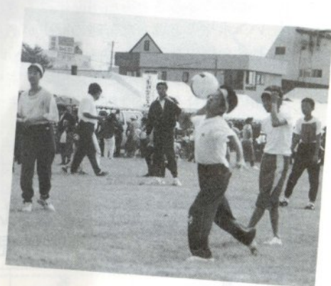
若さでいこう！ ドッジボール