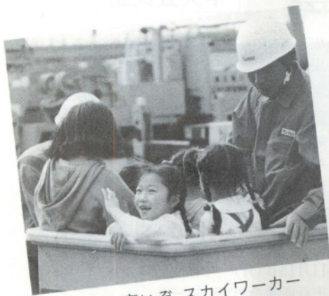
出発！ 高いぞ、スカイワーカー