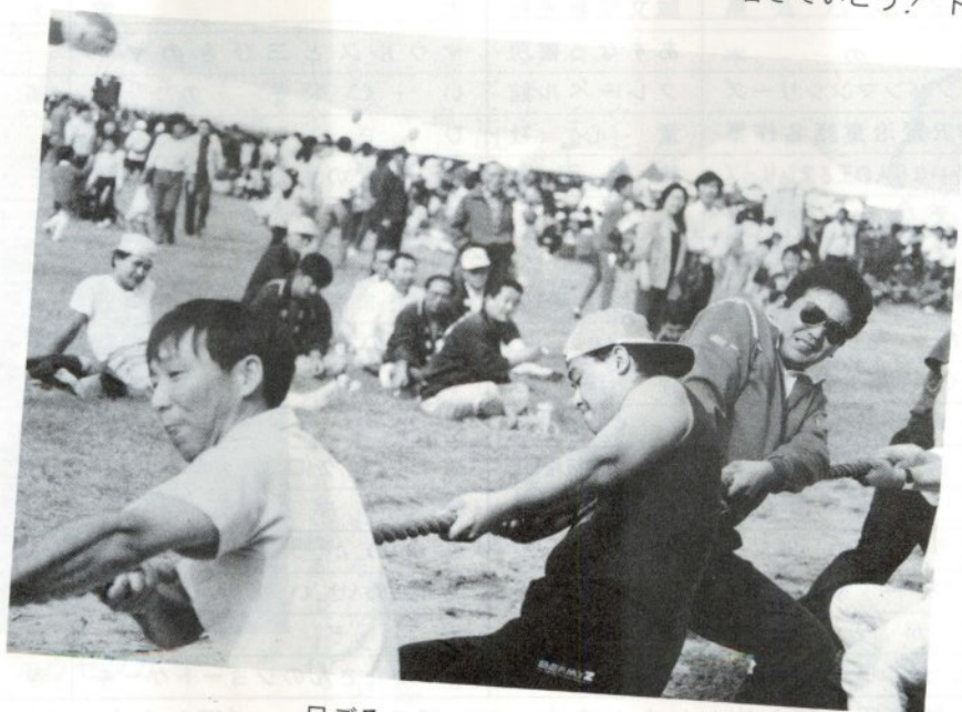
日ごろの力、今こそ！