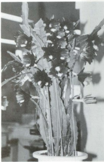
クジャクサボテン

花の世話は、それ程むずかしいものでもないんですよ。夏の間は風通しのよいところ、冬は凍らないように、特に夏の排水だけは気をつけています。サボテンは熱帯がふるさとも、日本のむし暑さには参ってしまうようですね。