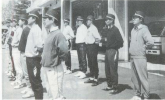
研修最後の仕上げ。「背骨を伸ばしビシッと！」 (消防署体験)

公務員としての責任と自覚、市の職員としての必要な知識の修得等を目的として、四月一日から五月末迄の二カ月間、みっちり研修を受けた、十四人の精鋭達は、六月一日、いよいよ本番の各職場に就きました。市民、ひとりひとりのしあわせのために、若さのエネルギーで、がんばります。市民のみなさん、応援して下さいね。