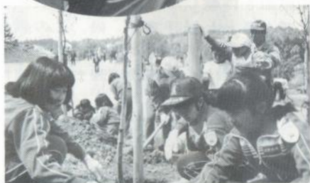
がんばる「緑の少年団」