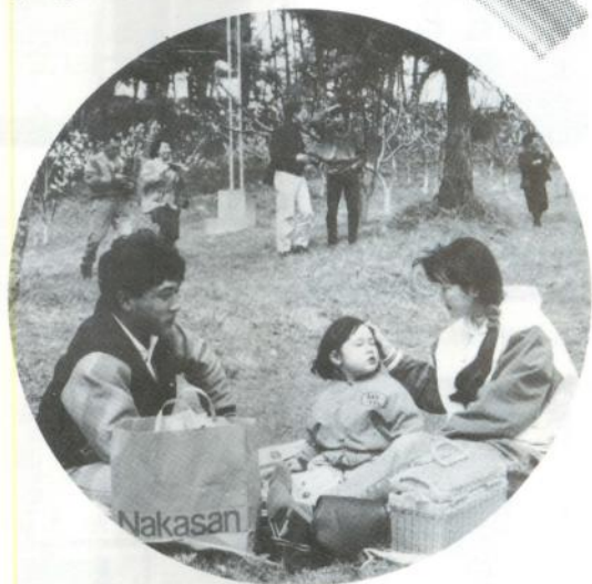
いいピクニック日和です