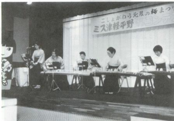
梅に、琴の調べ＝津島社中のみなさん