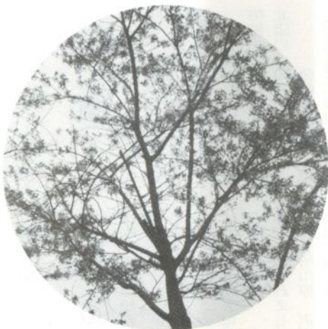
23年前の小学校入学記念樹 (市内 田町) (桜)

今、市内には子供達の成長と共に、大きく枝を張った梅、桜の樹々が茂り、若葉のそよぎを見せています。