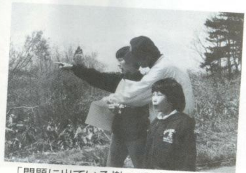
「問題に出ている樹って、あれかしら」

歩くことはとてもいいことですね。 市で呼びかけることには、 殆んど参加しています。 街に近くて、こんなにいい ところを歩けるなんて、 しあわせですね。