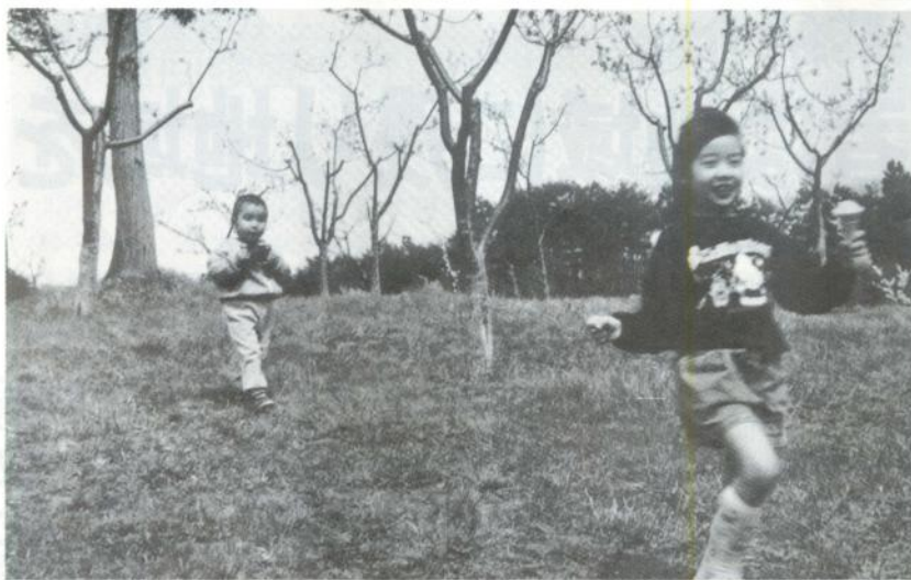
ボクはカメラマン。「お姉ちゃん待ってー」

四月十八日から三十日まで行われた、北限の梅まつり会場は、連日、好天に恵まれ、大ぜいの市民が梅林を訪れました。