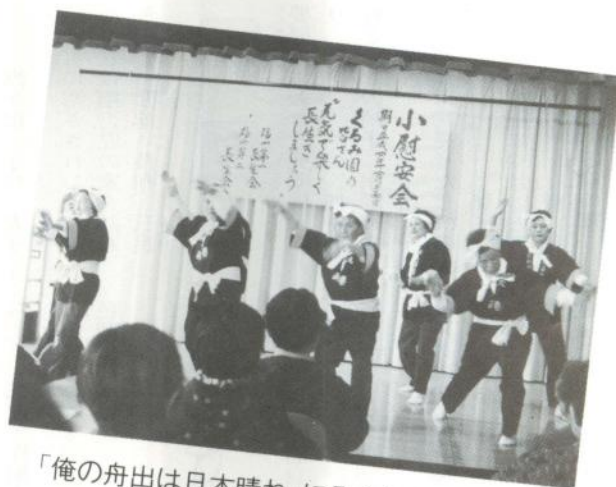
「俺の舟出は日本晴れ」にみんな大よろこび

完成は平成五年の予定でこの工事完成によって、昨年新築となった水道事業所中央管理センターとの集中管理が可能となり、よりおいしい水が、機能的に供給できることとなります。