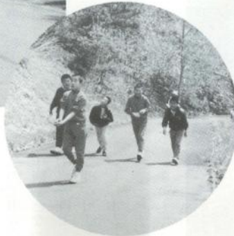
もうひとがんばり (野里小のおともだち)