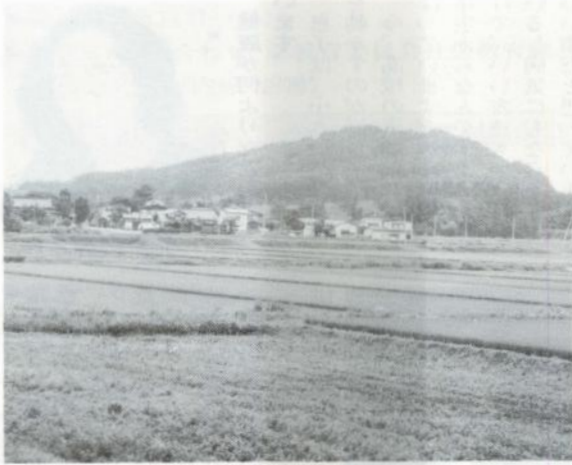
第1図 長者森館跡全景写真（神山館跡より撮影）

松野木集落の北に伸びる標高一〇七・六メートルの独立した丘陵地に位置する。尾根の北側には現在市営の墓地があり、上部は一部公園として整備されています。『長橋村誌』によると、岩城館として紹介され、「土師器や須恵器片が出土し、…炭化米も出た…」と記されています。現在それらの出土遺物がどこにあるのかは不明です。