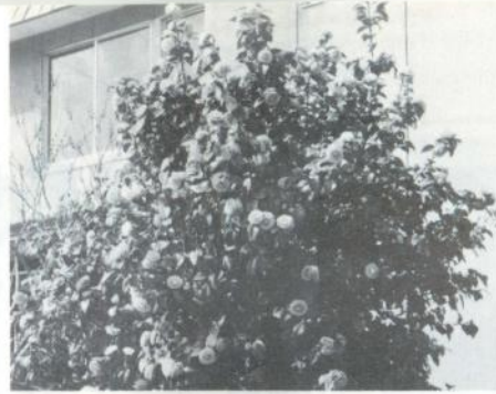
五月、街で見かけた花 (ツバキ)