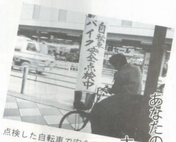
点検した自転車で安全運転