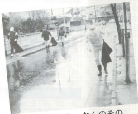
雨も、眠けも、なんのその