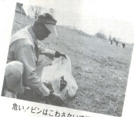
危い！ピンはこわさないでほしいな

四月十六日、シルバー人材センター五十人のみなさんは、岩木川河川敷・市役所前お祭り広場などのゴミ拾いに精を出してくれました。きれいになったお祭り広場では数千本のパンジーもいっそう生き生きとしています。