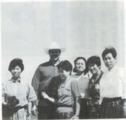
ハリス牧場に於て

カリフォルニアは、農産物の生産には適している気候だそうです。レタス、セロリ、ブロッコリーなどは、アメリカ全体の七〇％を生産しており、アーモンドの栽培も盛んでした。一户の農家が、平均七〇ヘクタール位を経営しており、経営内容も企業化しています。八月〜九月にかけて、野菜に水がほしいのですが、雨期は一月〜三月なので、地下水を利用していきます。そのため、どこへ行っても井戸が掘られていました。野菜栽培に対する国の農業規定も厳しく、一切農薬は使用していないという事で