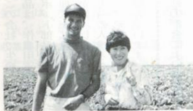
大規模農家の野菜畑にて

日本向けに、業者の要請でやむを得ずやっているとの事でした。日本側で、農業シャワーの原因を作っているとは……。わずか九日間の研修で、カリフォルニア農業のすべてが分かった訳ではありませんが、少しでも農家の心臓に触れる事が出来た様な気がします。この気持ちをごしよがわらに伝えて行きたいと思えます。