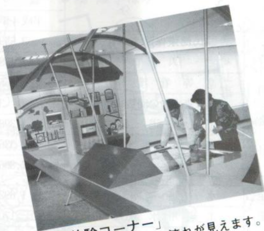
「体験コーナー」 ランプの点滅で水の流れが見えます。