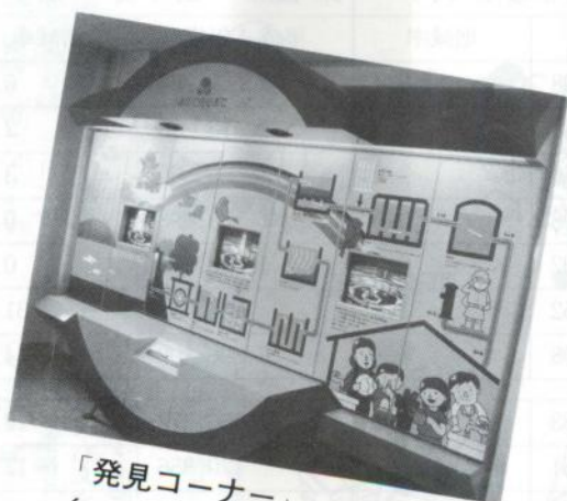
「発見コーナー」 くらしの中の水が見えます。