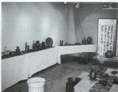
見事な作品の揃った展示会

広域市町村圏協議会が実施した事業の一つで、古くから当圏域に伝わる伝統工芸の振興とその後継者の育成を図る「工芸後継者育成事業」の一環として行った体験講習会の成果を発表したものです。