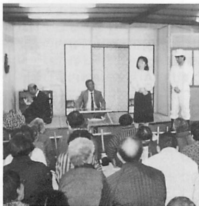
劇で慰問する「ばっけの会」の皆さん(5.22)

会世話人会代表を司会者に「読書の好きな子どもに育てるにはどうすればよいか」について懇談が行われ、参加者らは「子どもと読書」について熱心に話し合いました。