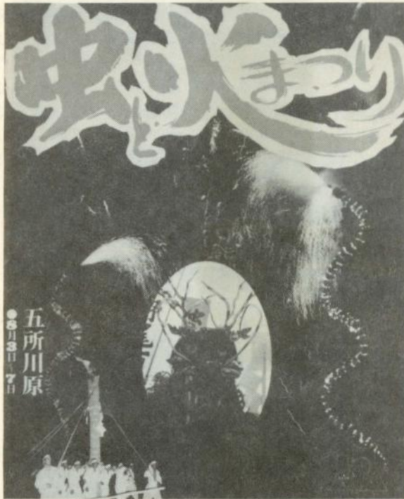
五所川原 ●8月3日・4日