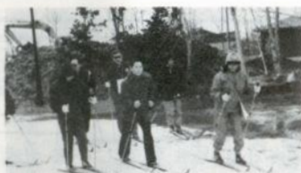
スキーウォークラリーの研修をうける指導者