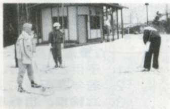
雪上グランドゴルフに興ずる参加者