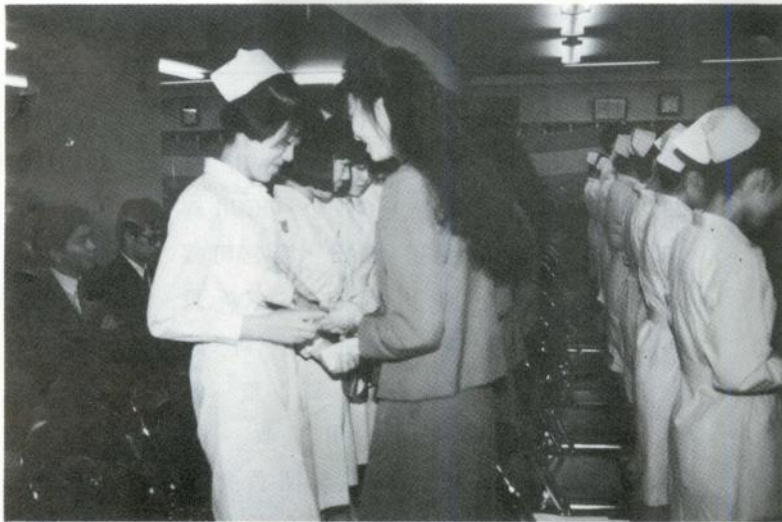
在校生から献花を受ける卒業生