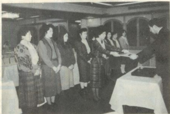
工藤署長から表彰状を受ける功労者