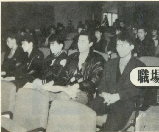
来賓の励ましに耳を傾ける就職者

参加者はこのあと、記念映画「翔ベィカロスの翼」を観賞、アトラクションのお楽しみ抽選会でのしいひとときを過ごしました。