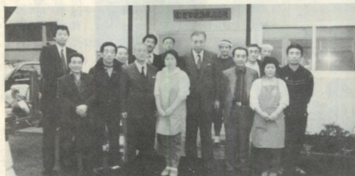
豊栄建設(株)会社で