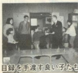
目録を手渡す良い子たち