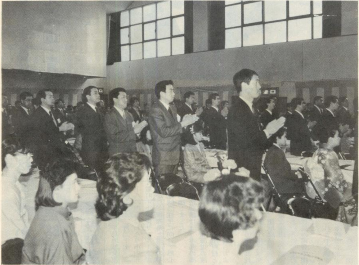
玉串奉奠にかしわ手を打つ参加者