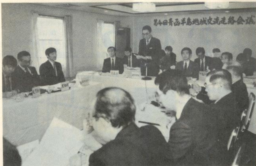
あいさつする其田総務部長