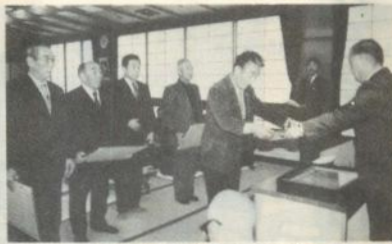
表彰状を受けるクラブ会長

前九時半から市老人福祉センターに単位老人クラブの会長八十人ほどが出席して開かれ、一年間無事故だった愛生会老人クラブ(敷島町)など十八の老人クラブを表彰しました。