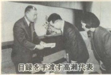
目録を手渡す高瀬代表