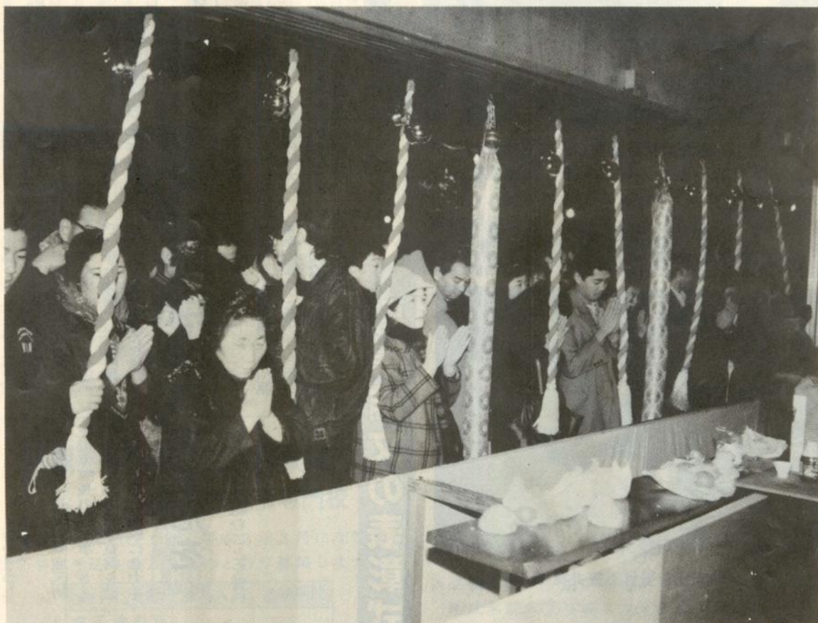
お祈りをする初もうでの市民