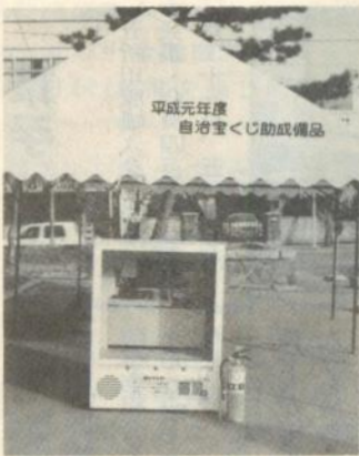
贈られた消火マスター

鶴寿会(上・下鶴ヶ岡)、長生会(杉派立)、第一・第二長生会(福山)、第二喜楽会(太刀打)、幸生会(川山)、松鶴会(松島町)、柏生会(柏原町)