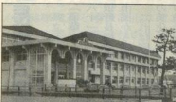
五所川原小学校建設事業