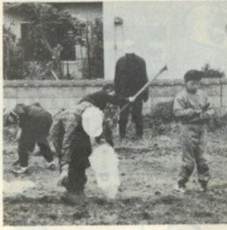
畑仕事に精を出す家族づれ