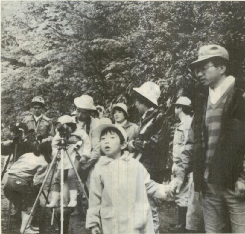
バードウォッチングを楽しむ参加者達