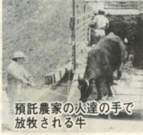
手での火達家の農家の預託放牧される牛

市営玉清水牧場で五月八日、黒毛和種の放牧を開始するとともに、今年の放牧牛の安全を願う祈願祭が預託農家など関係者約五十人が出席して行われました。 この日、約六十五頭の同牧場には成牛と子牛合わせて約百五十頭が放され、青々と伸びた牧場の草の上を走り回っていました。 一方、市営毘沙門牧場では同月九日から約百五十頭の放牧が始まりました。 この放牧は、両牧場とも十月いっぱいまで行われます。