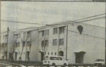
富士見団地公営住宅建設事業