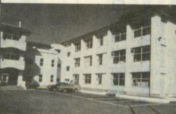
第三中学校建設事業