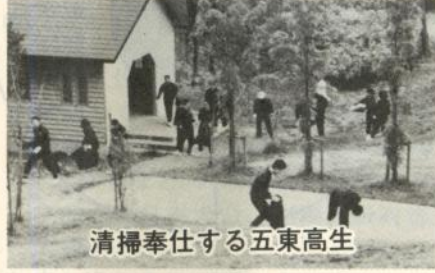
清掃奉仕する五東高生

県立五所川原東高等学校(須藤安二校長、生徒数百八十一人)では五月九日、狼野長根公園を清掃奉仕し市民から感謝されました。 これは同校が、地域社会の美化に協力し、社会奉仕の精神を養うことを目的に生徒会活動の一環として六年前から清掃奉仕を行って来ているもので今回は百八十人が参加しました。 清掃奉仕は午前九時半から約一時間半、六班に分かれて行われ、紙くずや空き缶、たばこの吸い殻などを収集、あまりのごみの多さに参加した生徒達もあきれていました。 同校では、このような奉仕活動を通して、ボランティア精神の大切さを学んでほしいと今後もこの活動を続けて行くことにしています。