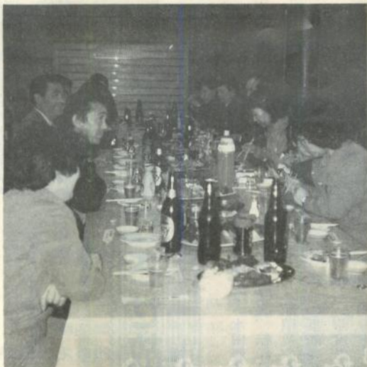
静岡県・矢崎計器での懇談のひとつ

激励するとともに、企業に對して漆川工業団地の概要などを説明し、市への工場進出を働きかけました。今回訪問したのは、静岡県、矢崎計器、矢崎部品、神奈川県(株)ニコ、日本電気、東京都の山崎製パン、