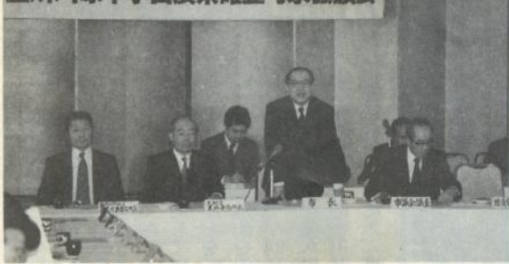
五所川原市水田農業確立対策協議会

の四・一五％)の農業者別配分方法―うるち米の事前売渡申込限度数量三十五万一千二百三十三俵の農業者配分は、転作目標面積を控除した耕作面積に反収六百二十kgを乗じて得た数値を基礎として配分するものとし、もち米百八十三俵については、六十三年度の実績により配分します。