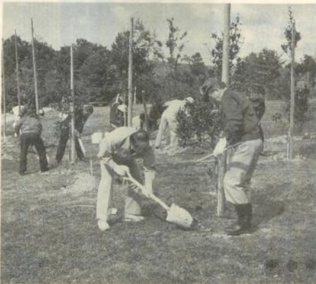
植栽する参加者たち

県と県猟友会では十月四日、狼野長根公園で野鳥の好む実のなる木の植栽を行いました。これは、鳥獣保護区に設定した区域内に野鳥の好む