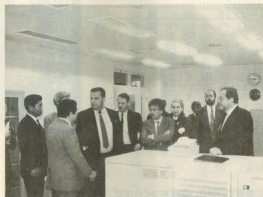
一行の視察団がコンピュータームを見学する。そのまま工作機械に連動し、実物を加工できるシステムや、最新式のコンピュータなど同校が誇る設備を興味深そうに視察し、「優れた設備が多く、手本になる」と感心していました。

一行は見学に先立って、同校近くのリング園でリング狩りを体験した後、辻校長と会食しながら懇談しました。