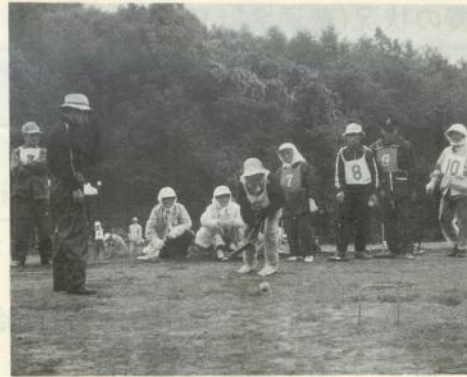
ゲートボールを楽しむ参加者たち

は、「毎回清掃奉仕をして感じることは、施設がいたずらされたり、紙くずや空き缶の多いことに驚かされま