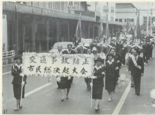
決起大会後行われたパレード

市交通事故防止対策本部(本部長・森田市長)ではこれ以上交通事故の犠牲者を出さないよう市民の決意を促そうと九月二十六日、