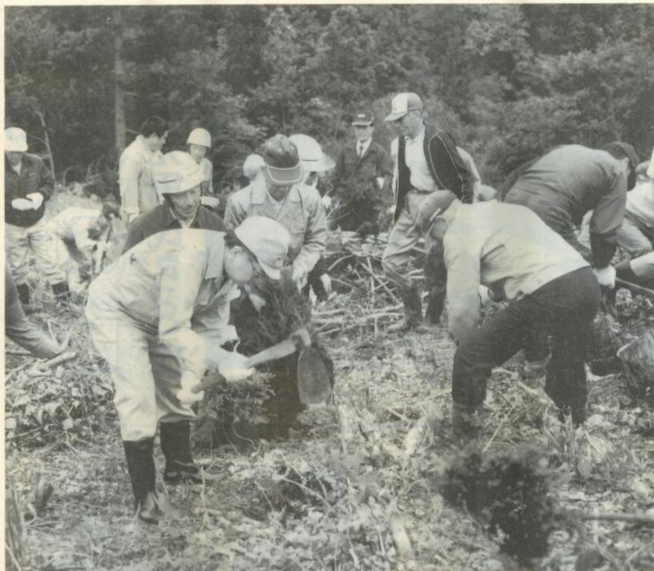
記念植樹する参加者たち