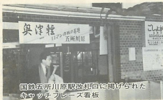
国鉄五所川原駅改札口に掲げられたキャッチフレーズ看板