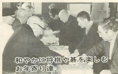
和やかに将棋や碁を楽しむお年寄り達