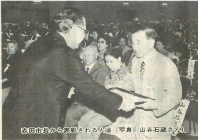
森田市長から表彰される人達

市では市民体育館で九月九日、市社会福祉協議会、市老人クラブ連合会と共催で「昭和六十一年度 市老人福祉大会」を開きました。これは、これまで社会に貢献してきたお年寄り達を慰労するとともに、その長寿と健康を祝うもので七十五歳以上のお年寄り約千二百人が出席。