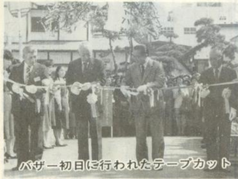
バザー初日に行われたテープカット