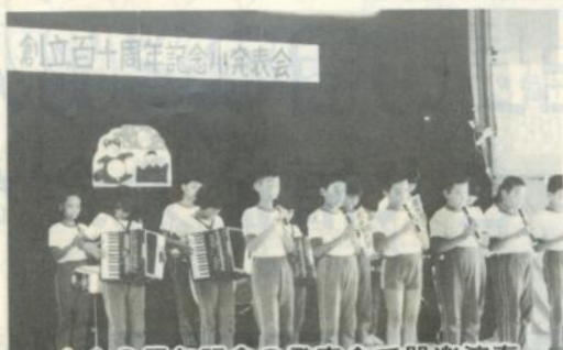
110周年記念の発表会で器楽演奏する子ども達 (9月7日 野里小)

明治九年に創立し、今年で百十周年を迎えた野里小学校(平塚邦夫校長 児童数百二十一人)で九月七日、同校でその記念式典が開かれ、百十周年を祝い合うと