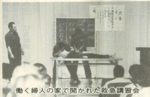
働く婦人の家で開かれた救急講習会

働く婦人の家で九月十二日、救急講習会が開かれ約五十人の市民が出席、初歩的な救急法を学びました。私達の日常生活の中では、いろいろ不測の事態が発生することがあります。例えば心臓発作、脳卒中、水に