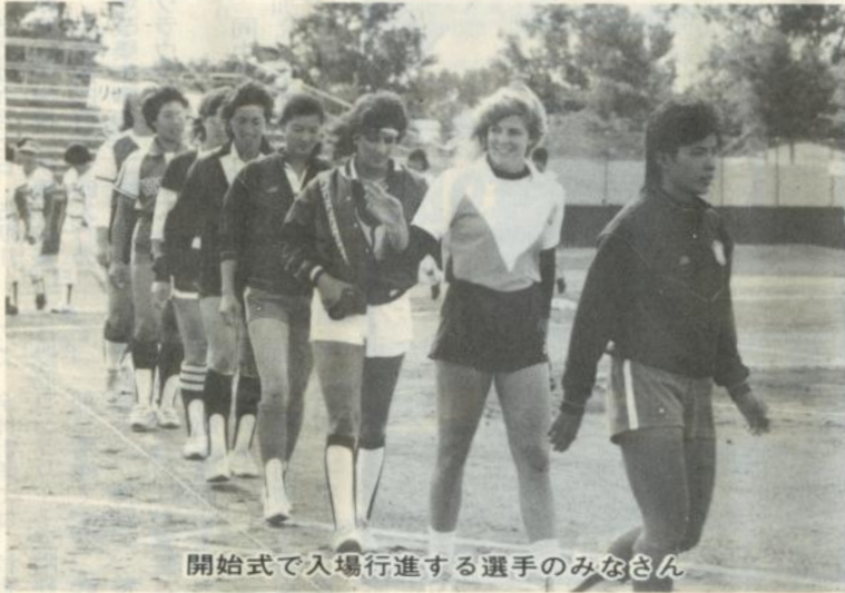
開始式で入場行進する選手のみなさん

「国際女子ソフトボール大会「86ジャパンカップ」の五所川原大会が九月四日、市営球場で開かれ、スタンドを埋めた約二千五百人の観客は世界最高レベルのプレーを十分にたんのうしませた。 同大会は、日本ソフトボール協会が招待の形で開いているもので、本県はもちろん、東北でも初めて。市