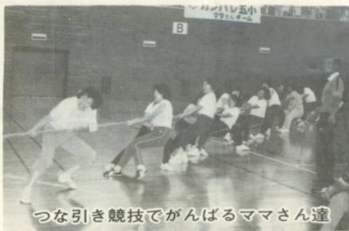
つな引き競技でがんばるママさん達

市民体育館で九月七日、「第17回学区対抗ママさん体育大会」が開かれ、各学区から選手など約四百人が参加しました。同大会は、日頃運動が不足しがちな婦人達の健康と体力の増進を図り、市民のスポーツへの関心をより一層盛り上げると共に、参加者の親睦を深めようと市教委が主催しているもの。