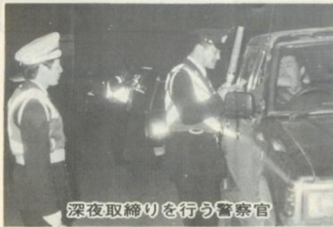
深夜取締りを行う警察官

県警本部では、祭りや月遅れ盆、夏休みなどが控えた七、八月の二か月間を「交通死亡事故抑止サマー作戦」と定め、各種運動を展開、総力を挙げて犠牲者絶滅に取り組んできました。 五所川原署でも集中検問を行い重大事故に直結する飲酒運転の取締りに目を光らせてきましたが、検挙者