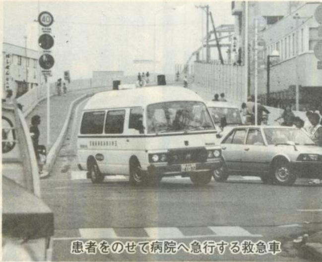
患者をのせて病院へ急行する救急車

このため、同署では市民から要望があれば、「救急法」の講習会に積極的に出向いて指導を行っています。今年、既に八団体、三百八十人が受講しました。海や山へ出かける前に、あるいは知っておきたい知識・技術として、町内で、