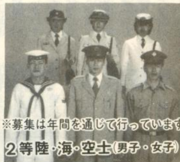
※募集は年間を通じて行っています 2等陸・海・空士(男子・女子)