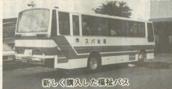
新しく購入した福祉バス

市では、このた び新型の福祉バス を購入しました。 これは、従来の 福祉バスが購入後 すでに十年余経過 し、修理も限界に