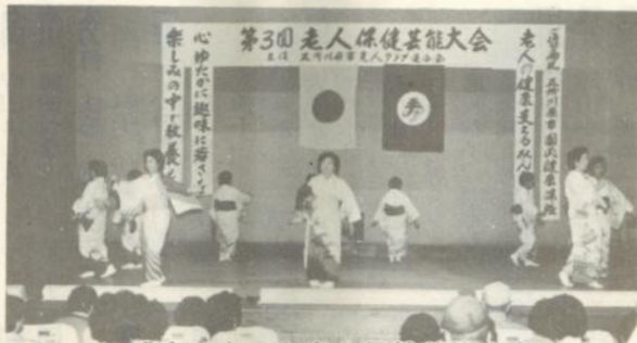
盛会であった老人保健芸能大会