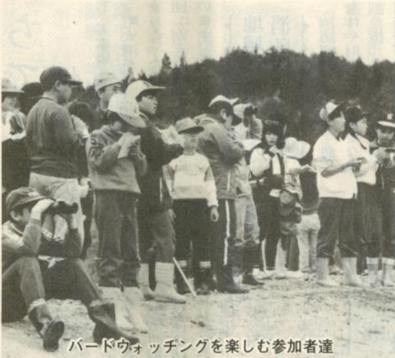
バードウォッチングを楽しむ参加者達

飯詰・味噌ヶ沢の「野鳥の村」が5月18日オープンし、開村式を兼ねた恒例の自然観察会に親子づれなど約130人が参加。野鳥と野草の2グループに分かれ、参加者は自然を心ゆくまで満喫していました。