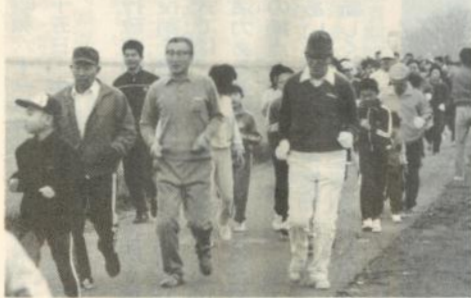
走り初めでジョギングを 楽しむ参加者達。