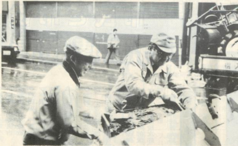
クリーン作戦初日、気連連合町内会長とともに泥やゴミの収集作業をする森田市長(右)

雪が消えると街のいたる所に、ゴミや泥が目立つようになりました。 市では、今年も四月二十五日から「春のクリーン作戦」を開始しました。これは、市民と行政が協力して