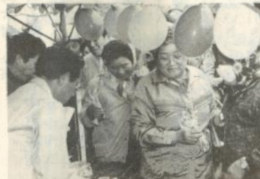
苗木の無料配布を受ける市民

会場には、苗木や鉢植えを売るビニールハウスなどが立ち並び、それを買い求める市民で大にぎわい。このほか緑化まつりでは、ナツシタなどの苗木の無料配布、「洋蘭の鉢替え管理」