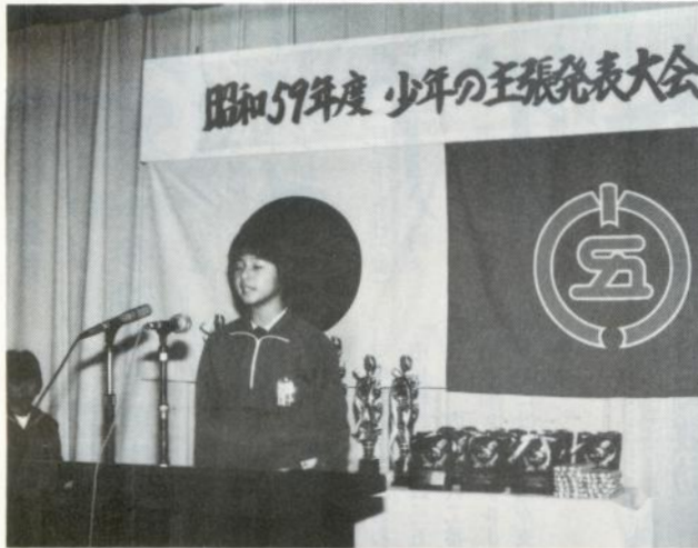
力強く自分の意見を発表する代表者