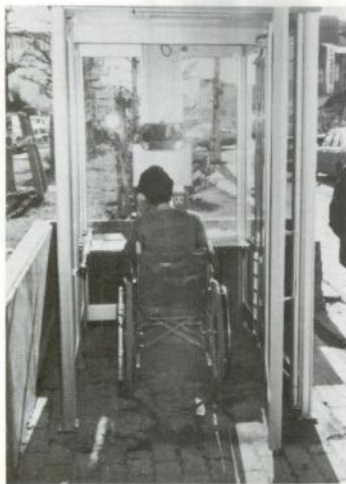
車イスのままで電話がかけられます