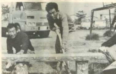
ベンチを取付ける訓練生たち

環境美化に役立ちたいという同協会の指導にもつき、市内五ヶ所の児童遊園地に設置したところ、地域住民から大変喜ばれています。 また、みちのくコカ・コ