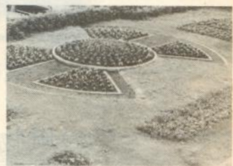
県庁舎前の花だん