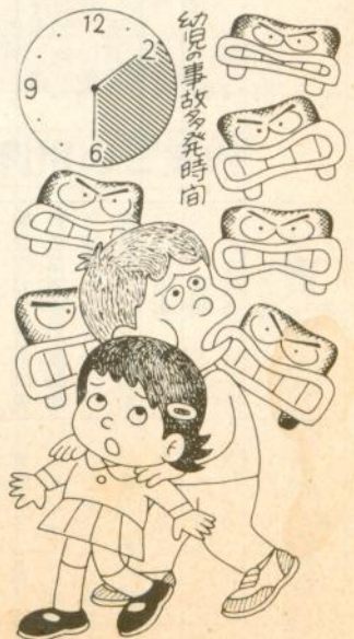
幼児の事故多発時間