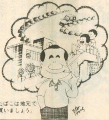
●たばこは地元で買しましょう。