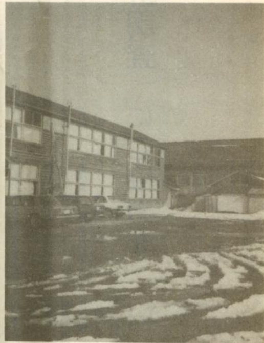
※なお、幹部社員の応募締切は12月20日、面接日は12月24日となっておりますが、くわしい事は市商工観光課(☎352111、内線 260)にお問い合わせ下さい。

市本庁・各支所、市民文化会館、市中央公民館、三道会館、福祉会館、福祉センター、市民体育館、市勤労青少年ホームは、十二月二十九日(木)から一月三日(火)まで休みます。 また、市立図書館は、十二月二十八日(水)から一月四日(水)まで休館します。 西北中央病院は、十二月二十九日(木)から一月三日(火)まで診療・窓口業務を休みます。