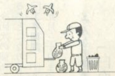
10月1日 就業構造基本調査

総理府統計局では、十月一日を中心として、就業構造基本調査を実施します。皆さんのご理解とご協力を