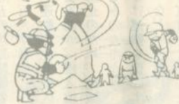
地域の連帯意識を強めるためのスポーツ大会など