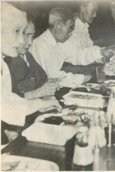
「くるみ園」で開園と誕生会を祝う