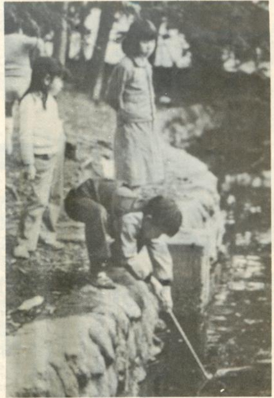
水辺での遊びは危険がいっぱい