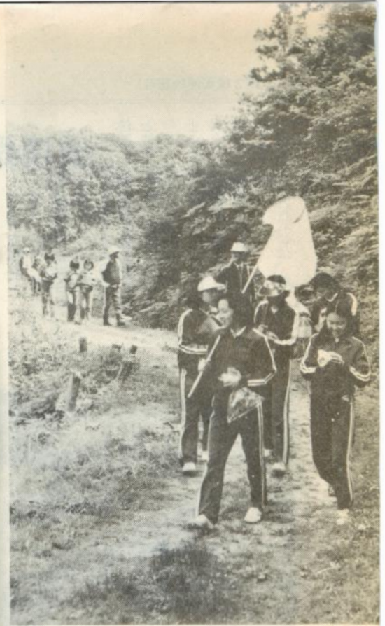
市民自然観察会を開催