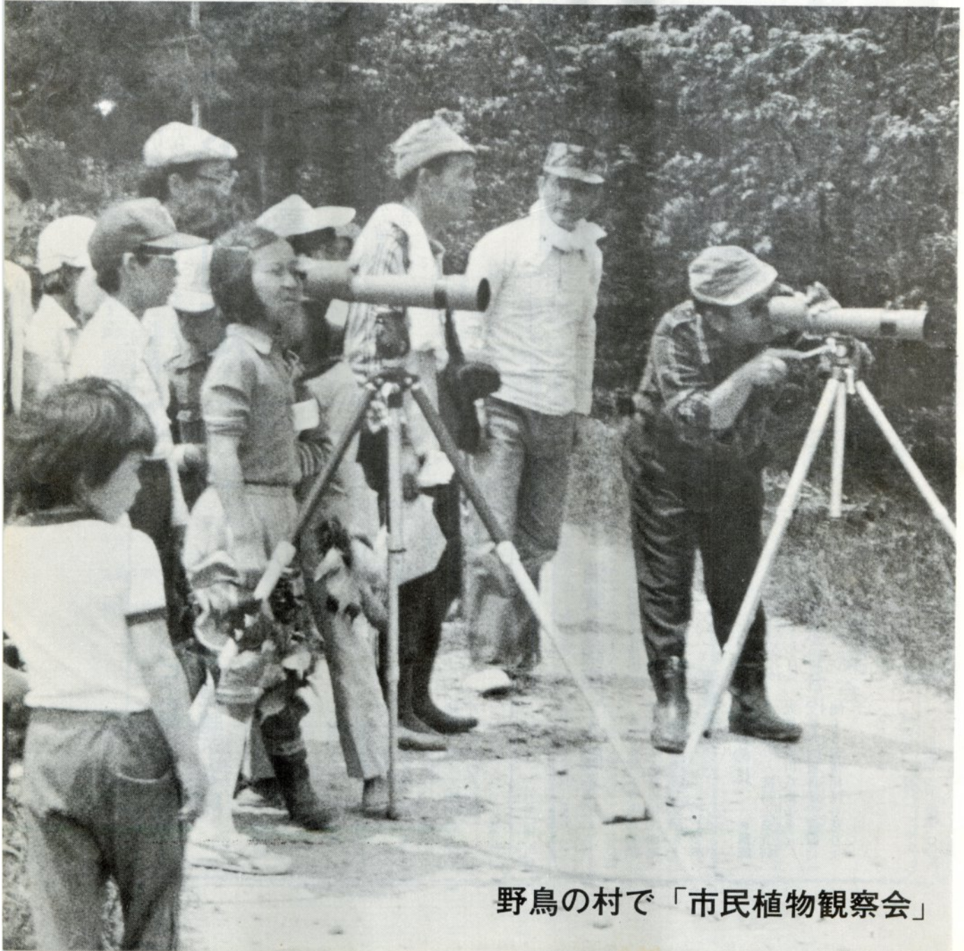
野鳥の村で「市民植物観察会」