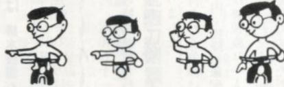
進 → 右折 → 左折 → 停止

▽正しい自転車の乗り方 ①自分の体にあつた自転車に乗ること。②正しい合図の仕方を知ること。③乗るときもおりるときも自転車の左側から、④乗るときは道路の左側を一列に、二人乗りは必ずやめること。⑤せまい道路から広い道路にでるときは必ず一度と