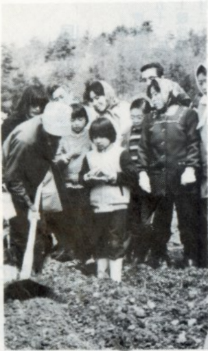
係員の指導を受ける参加者

域新農業センターで開園し ました。 開園したちびっ子農園は、 は、三十平方メートル(約九・二 坪)と十五平方メートル(約四・