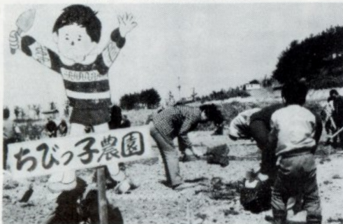
にぎわった「ちびっ子農園」

ちびっ子農園では、八月 十四日に収穫感謝祭(いも 煮会)を予定しており、秋 の収穫を楽しむにしており ます。