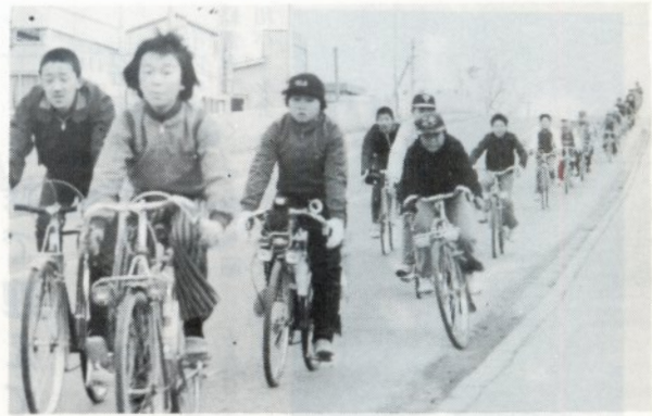
今年初めての「おはようサイクリング」